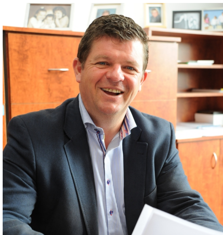
Staatssecretaris Bart Tommelein (Open VLD).

VAN ONZE MEDEWERKER EDWIN FONTAINE OOSTENDE/DE HAAN | Het consortium iLand, bestaande uit acht bedrijven, waaronder de grote Vlaamse baggeraars en Electrabel, heeft zich gemeld om het project vijf kilometer voor de kust van De Haan te realiseren. De eerste tekeningen tonen een ovaal van 2,8 kilometer lang, met een omtrek van 6,5 kilometer. Staatssecretaris Bart Tommelein wil niet over één nacht ijs gaan en wint voor het jaareinde adviezen in over de gevolgen van de bouw van de eilanden voor de kust. 'Na dat rapport kent de regering in het voorjaar van 2015 de concessie toe. De bouw kan beginnen in 2018 en het energie-atol zal uiterlijk in 2021 operationeel zijn.'